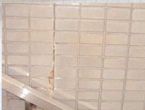
エフロは美観性を損なうだけでなく、タイルの剥落の原因となります。

(注意事項：酸性洗剤を用いて洗浄後に塗布した場合には変色するおそれがあります。 必ず専用のアルカリ洗剤にて中和処理後に塗布してください)