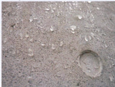
施工後数年後の撥水性能