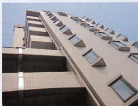
施工後の様子。外観の変化はありません。(※1)