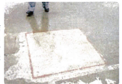
北海道 屋上駐車場コンクリート床 6年経過後の写真(赤枠内のみ試験施工)

Sクリートガード®は氷点下20℃までの温度環境でも施工可能です。凍結融解や融雪剤など、コンクリートにとって厳しい環境でも優れた効果を発揮します。