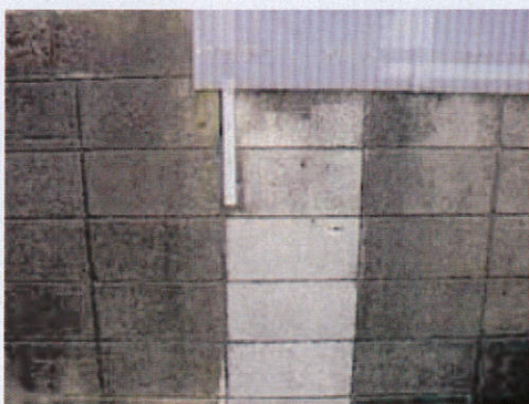
黒カビで汚れたセメントブロックの一部にSクリートガードを塗布した実験です。Sクリートガードの高いセルフクリーニング効果により、黒カビが徐々に消失していきます。(※2)