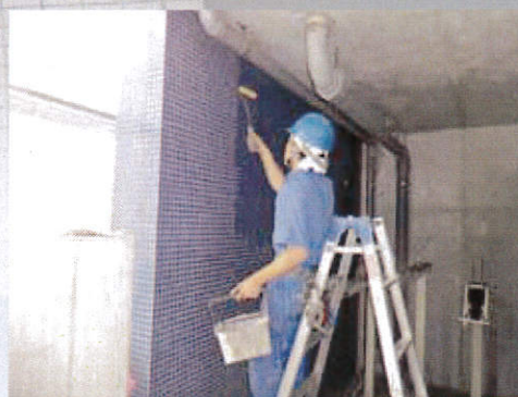
タイル面へのローラーによる施工