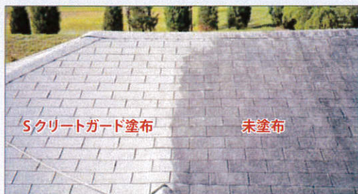
セメントタイルへの施工